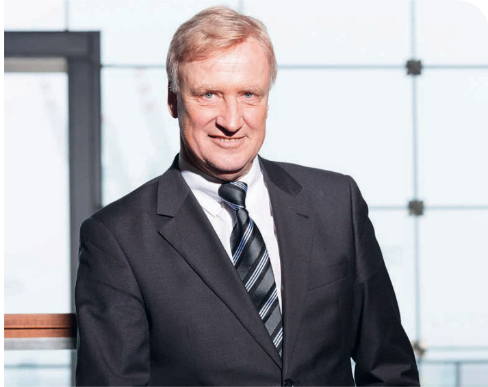
Ole von Beust Rechtsanwältin

> Der ehemalige 1. Hamburger Bürgermeister Ole von Beust hält auf dem Workshop „Zukunftsmärkte: Türkei“ einen Vortrag