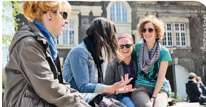
> Studierende nutzen die Pause zwischen den Vorlesungen

Der berufsbegleitende Master of Science Erneuerbare Energien ist deutschlandweit einzigartig. Akademisch trägt ihn die Hochschule für Angewandte Wissenschaften Hamburg und führt ihn in Kooperation mit der Akademie für erneuerbare Energien Lüchow-Dannenberg GmbH durch. Maximal 25 Studierende pro Jahrgang aus den Ingenieur- und Wirtschaftswissenschaften sowie verwandten Fachbereichen beginnen das Studium.