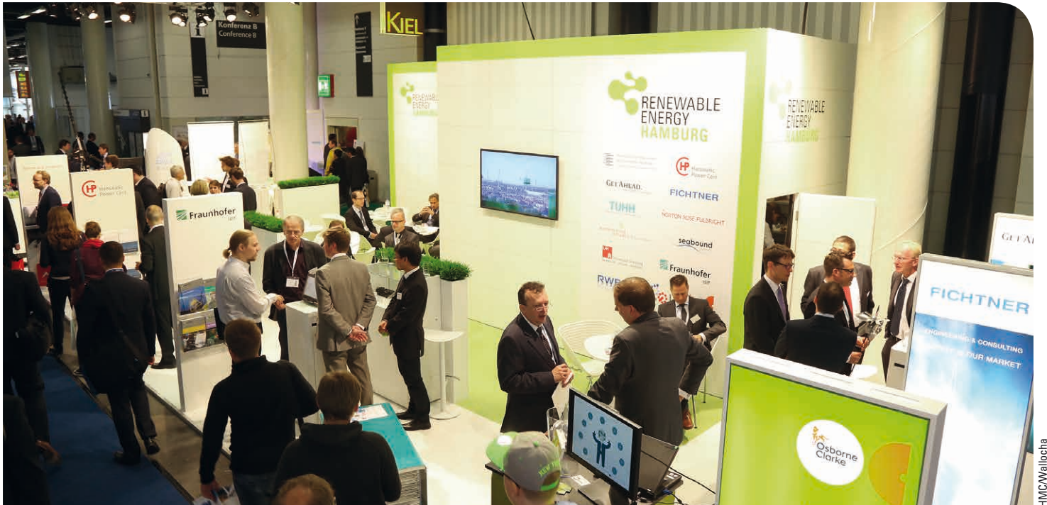
> Aktuell läuft die Bewerbung für Unteraussteller auf dem EEHH-Gemeinschaftsstand auf der Messe Husum Wind vom 15. bis 18. September 2015