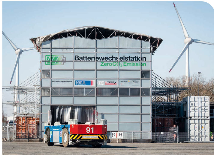
> Batteriewechselstation auf HHLA-Terminal

Batteriebetriebene automatische Schwerlastfahrzeuge – Zukunftsvision oder bereits Realität? Auf dem Container Terminal Altenwerder (CTA) der Hamburger Hafen und Logistik AG (HHLA) fahren bereits heute zehn Automated Guided Vehicles (AGV). Das Forschungsprojekt Batterie-Elektrische Schwerlastfahrzeuge im Intelligenten Containerterminalbetrieb (BESIC) untersucht seit Anfang 2013, welches der operativ und ökologisch optimale Zeitpunkt für die Batterieladung ist. Das Bundesministerium für Wirtschaft und Energie fördert das Projekt.