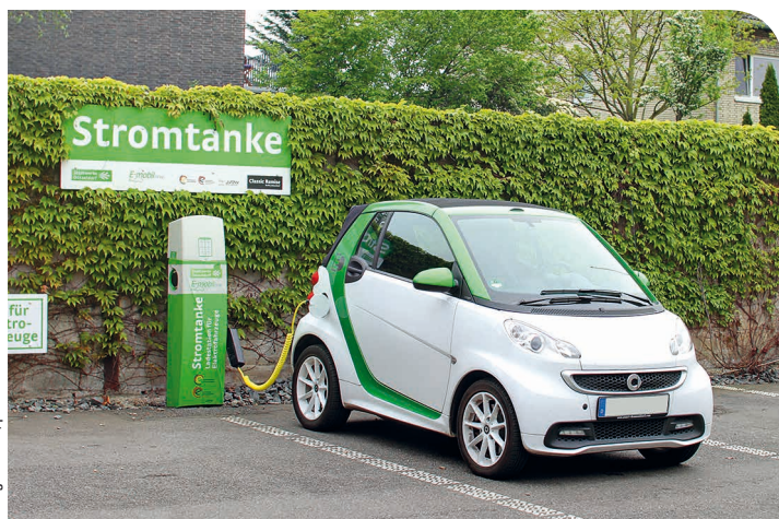
> Elektromobilität erfreut sich in der Freien und Hansestadt Hamburg immer größerer Beliebtheit

Wer kennt sie nicht? Die Blankeneser Bergziege – ab November 2014 fährt Hamburgs berühmtester Bus mit Batteriebetrieb. Das Fahrzeug stammt vom italienischen Hersteller Rampini aus Passignano sul Trasimeno, aufgeladen wird es am Blankeneser Bahnhof.